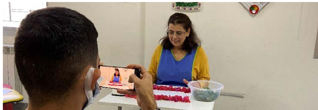
Una docente de SESOBEL graba un tutorial para los padres.